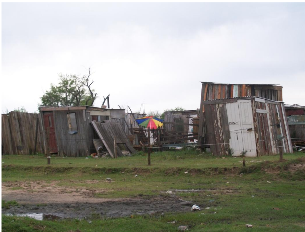
Figura 5 – Casebres construídos em áreas invadidas, atualmente, no Loteamento Ceval - 2009.

Observou-se, em alguns terrenos, que existem também casas de madeira no fundo do pátio, geralmente, remanescentes da época da invasão. No entanto, obteve-se a informação que, algumas casas de madeira, foram construídas recentemente, no fundo do quintal com a finalidade de abrigar outras famílias (geralmente, parentes), ou até mesmo, prover um aumento nas edificações de alvenaria, como a construção da tenda acima mencionada. Também foram identificadas moradias em outras áreas do Loteamento Ceval, as quais, apesar de não estar destinadas a construção de residências, continuam sendo invadidas, como mostra a figura abaixo: