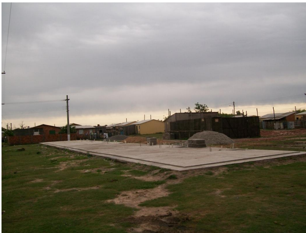
Figura 4 – Área baldia no Loteamento Ceval - 2009

Praças e áreas de lazer também inexistem. Os locais de lazer representados no mapa do Loteamento Ceval (Fig. 2) são apenas terrenos baldios (campos). Foi verificado que as crianças brincam numa área baldia, que segundo os moradores, os funcionários da SEUrb haviam lhes informado que construiriam uma praça. Contudo, atualmente nesse espaço estão sendo construídas quatorze novas casas para acomodar mais pessoas de outros locais da cidade, como pode ser identificada na figura a seguir: