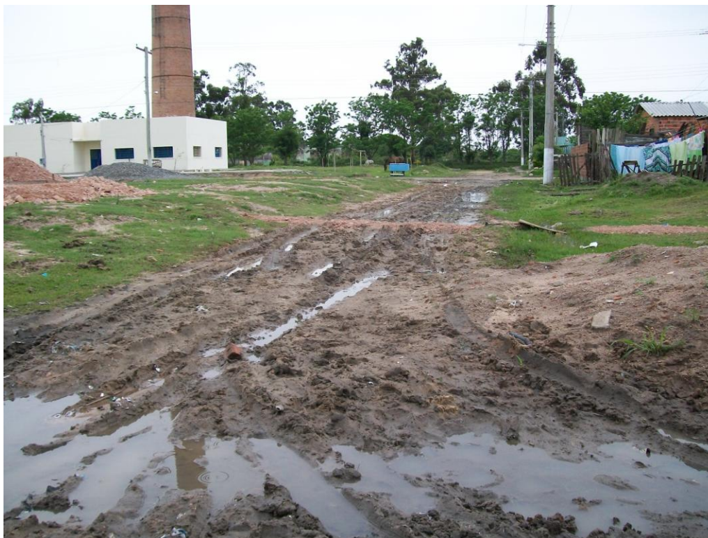
Figura 3 – Rua coberta de lama no Loteamento Ceval.

A problemática dos alagamentos e barro por ocasião das chuvas pode ser identificada na figura a seguir: