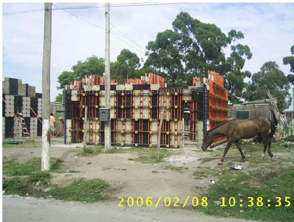
Figura 7 - Módulos desenvolvidos pelo Projeto NINHO -2006.

De acordo com Eneida, as casas seriam construídas através do mutirão. No entanto, somente as vinte primeiras casas foram construídas assim. Em seguida, as pessoas que integravam o mutirão abandonaram o trabalho. Segundo ela, o sistema de mutirão não deu certo por vários fatores "Muitas vezes, o pessoal estava organizado para o trabalho, porém não chegava o material. Ou então, havia conflitos pela falta de compromisso de alguns integrantes". 1