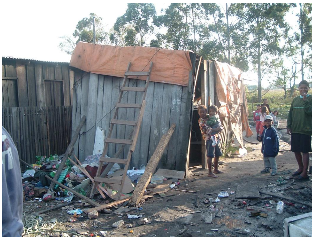
Figura 6 - Casebres improvisados no Loteamento Ceval por ocasião da invasão -2004

Após vários meses de resistência e luta dos moradores, houve então, a promessa do poder local de prover moradia e infraestrutura para a área invadida. Todavia, a condição precária dos moradores estava longe de acabar, durante dois anos os moradores acomodavam-se em barracas feitas de lonas ou casebres, conforme a figura abaixo: