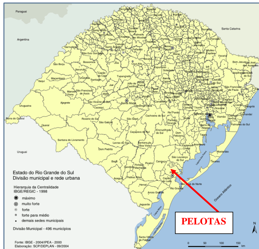
Figura 1 - Mapa do Rio Grande do Sul destacando a localização do município de Pelotas.

O município de Pelotas faz parte da região fisiográfica denominada “Encosta do Sudeste”, uma subdivisão do estado do Rio Grande do Sul.