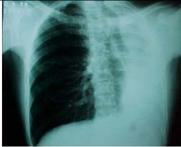
FIGURA 1 – Radiografia de tórax demonstrando opacificação do hemitórax esquerdo.