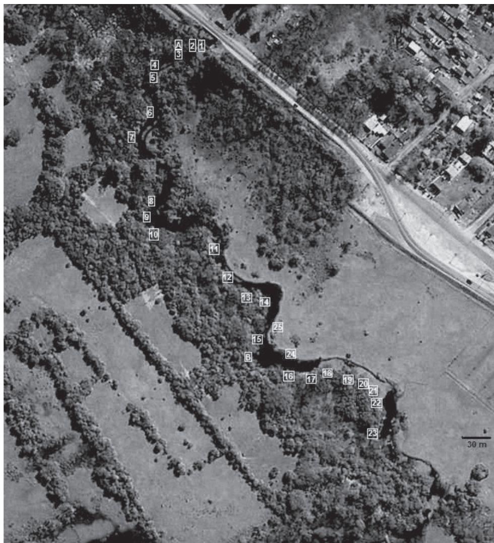
Figure 2. Image of study area (Bolaxa stream, Lagoa Verde Environmental Protection Area, RS) showing the location of shelters (A, B) and latrines (1-25) of Lontra longicaudis found from July 2008 to July 2010.

de sinais de utilização nos abrigos. As fezes foram também os vestígios mais encontrados nos trabalhos precedentes sobre a ecologia espacial de L. longicaudis no Sul e Sudeste do Brasil (Soldateli e Blacher, 1996; Waldemarin e Colares, 2000; Brandt, 2004; Kasper et al. , 2004). Já a deposição de secreção anal não associada à deposição de fezes foi encontrada em três ocasiões nas latrinas, enquanto que a identificação de pegadas não associadas à deposição de fezes ocorreu em cinco verificações nas latrinas e em