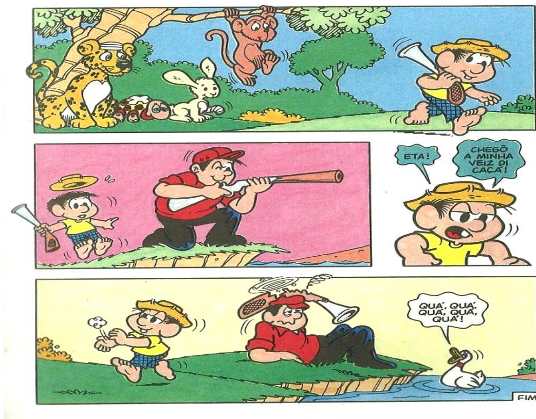
Figura 01: parte final da história “Vamos Caçar”, coleção um tema só Chico Bento – Natureza, 2003.

Na história, Chico Bento sai para caçar, porém muda de comportamento e termina combatendo a prática do caçador.