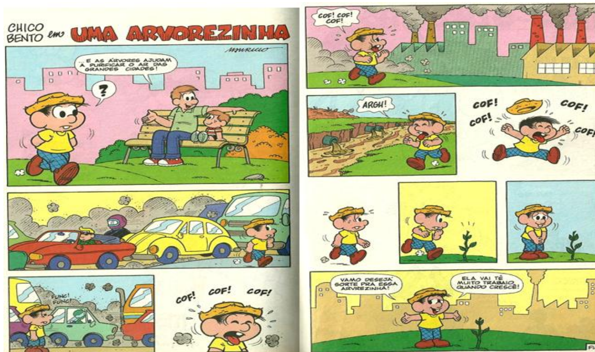
Figura 02: parte da história “Uma arvorezinha”, almanaque nº 5 de outubro de 2007.

Essa história é relevante para a formação de um sujeito crítico, pois leva a reflexão sobre o que causa a poluição e como esta pode ser diminuída, além de como a poluição pode afetar a saúde. Lisbôa (2008) relata que o discurso que apenas mostra os problemas e não sugere alternativas para solucioná-los é bastante vazio, pois não se educa com catastrofismos ou mostrando apenas os fatos tristes que estão ocorrendo na natureza.