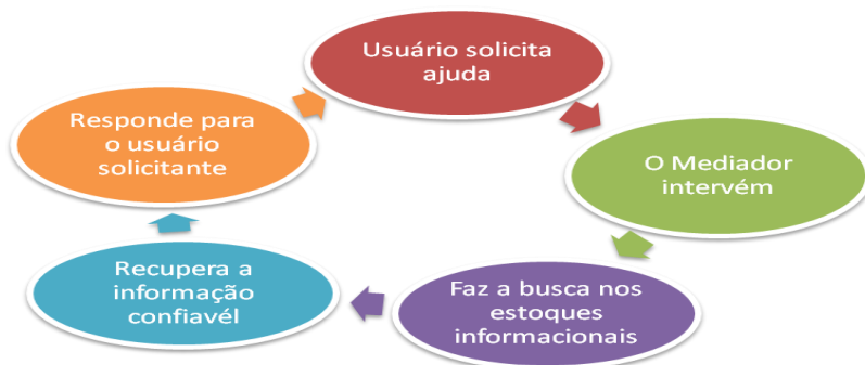
Diagrama representativo construído pela autora.

Almeida (2008) sugere a construção de uma estrutura coordenada de comunicação entre o usuário, o mediador, e como resultado da mediação, a informação como resposta.