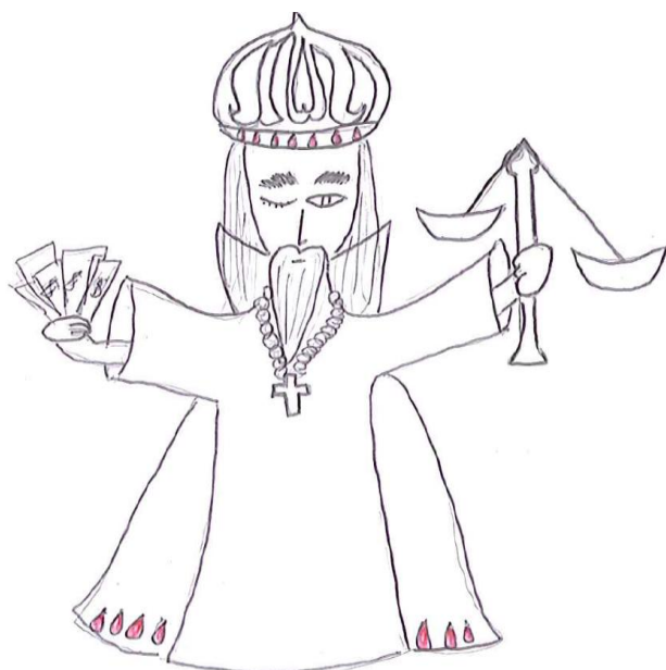
Balança da Justiça 3