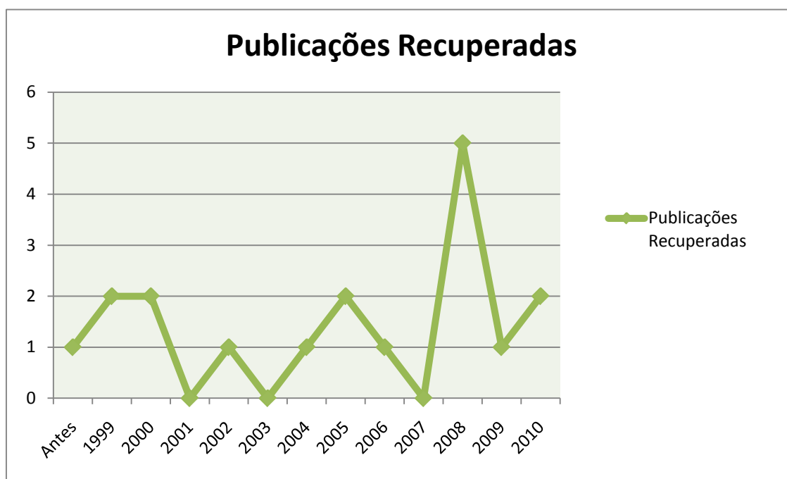
Figura 2 - Produção científica por ano.

seguintes, passando para seis publicações, e continuou aumentando a partir daí, de 2006 a 2010, se somam onze publicações sobre o assunto discutido pela comunidade científica.