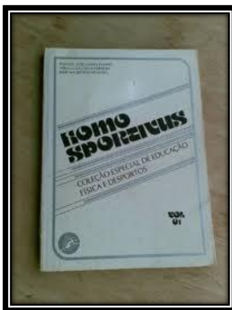
Figura 01- Imagem do livro HOMO SPORTIVUS

Dentro desta perspectiva, ressalto o ano de 1984, quando ocorreu a publicação, no Brasil, de um livro nomeado especificamente de “Homo Sportivus” (TUBINO; FERREIRA; CAPINASSU, 1984), conforme se pode verificar na figura abaixo.