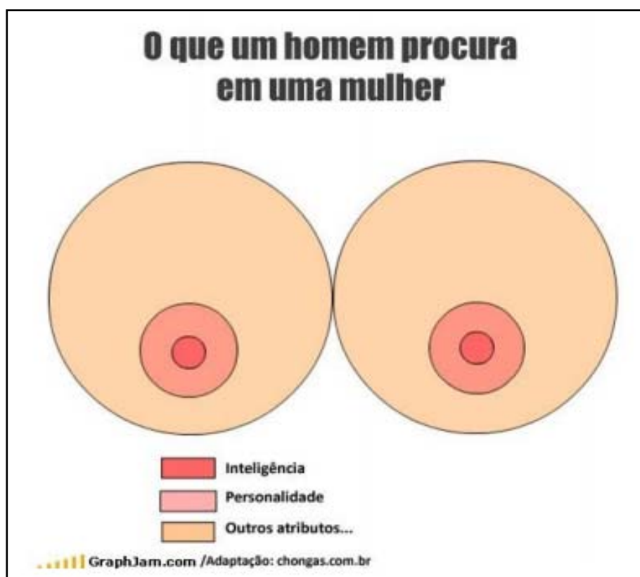
Figura 3- O que um homem procura em uma mulher

Com efeito, não interessa inteligência da mulher e nem a sua personalidade, mas sim “outros atributos”. Diante do belo par de seios com o qual o texto humorístico abaixo faz uma clara analogia (figura 3), fica fácil induzir que esses “outros atributos” tem a ver com o corpo: