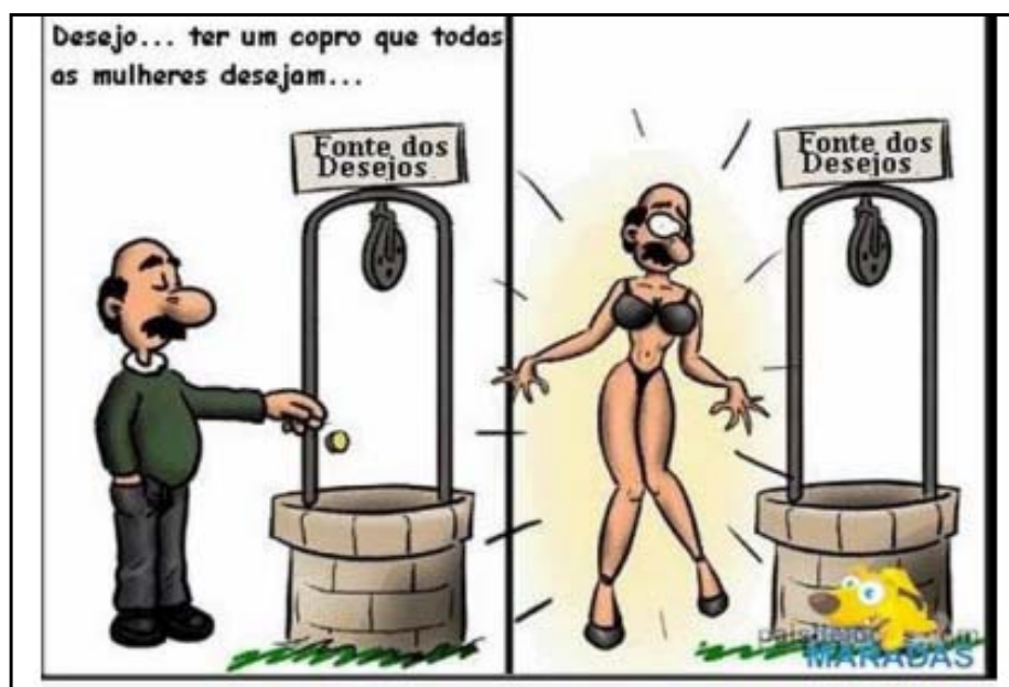
Figura 4- Fonte dos desejos

A fonte dos desejos realiza a transformação solicitada pelo homem no texto humorístico a seguir e nos revela que o anseio maior das mulheres, para além de qualquer outra coisa, seria o corpo modelado, pernas torneadas, cintura fina, seios fartos, bumbum durinho e abdômen trabalhado (figura 4):