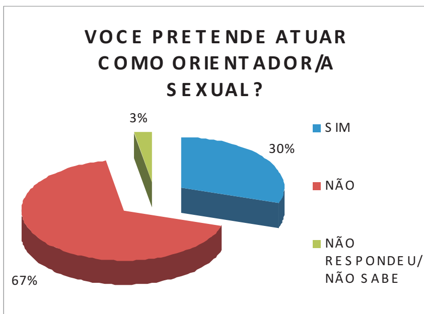
GRÁFICO 5 - Se o aluno pretende atuar como orientador sexual

Em seguida, buscamos inquirir se os participantes pretendiam atuar como orientadores sexuais. Os dados alcançados com esta indagação estão contidos no Gráfico 5.