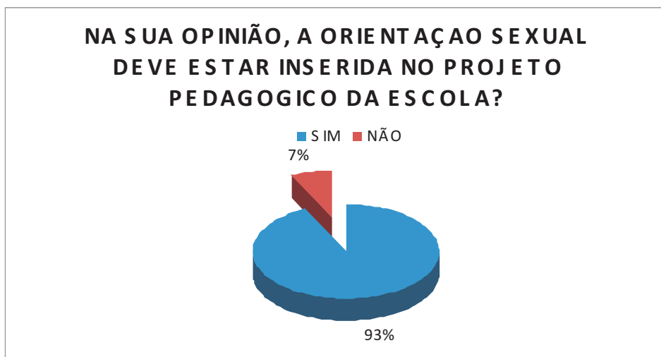
GRÁFICO 4 - Se o trabalho de orientação sexual deve estar inserido no projeto pedagógico da escola

A questão seguinte do questionário versava acerca da opinião do aluno se o trabalho de orientação sexual deveria estar inserido no projeto pedagógico da escola. Os dados desta pergunta são mostrados no gráfico a seguir.