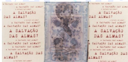
FIGURA 3 – A salvação das almas, de Rosana Paulino

A face oculta do colonialismo operou na naturalização do branco como sujeito universal e ideal a ser seguido (LEITE, 2020) e por linhas de classificação, atreladas ao capitalismo, responsáveis por estruturar gênero, raça e trabalho (QUIJANO, 2002). A imposição de um modus operandi binário e atomizado – macho/fêmea; branco/negro; ocidente/oriente; império/colônia; alma/corpo; civilizado/selvagem – configurou racismos e sexismos (LUGONES, 2014).