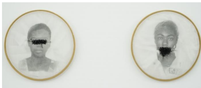
FIGURA 2 – Série Bastidores, de Rosana Paulino

Como iniciar um texto/aula com imagem? Que desdobramentos a leitura de uma imagem pode proporcionar para se produzir escritas, outros pensamentos sobre o corpo e sobre biologia e arte? Como as pedagogias culturais aparecem nas poéticas visuais para nos ajudar a fomentar o pensamento decolonial em arte com atravessamentos biológicos, culturais, políticos e sociais?