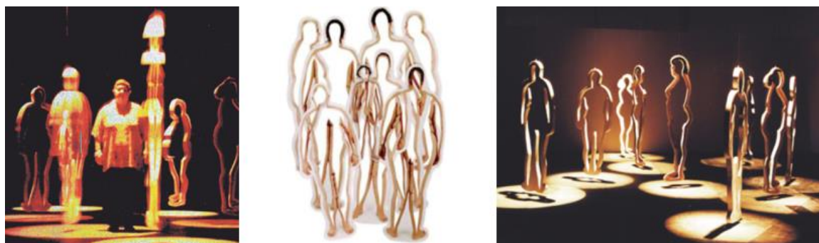
FIGURA 1 – Imagem composta a partir da foto performance e instalação “Classificações científicas da obesidade”, de Fernanda Magalhães