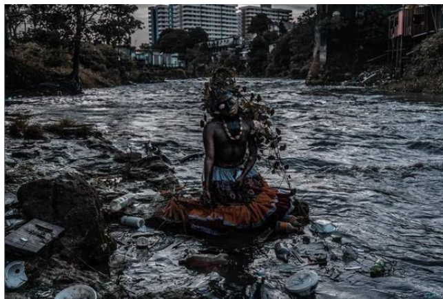
FIGURA 6 - Na alegria ou na tristeza II e III

É esse hibridismo retratado por Uýra Sodoma (FIGURA 06), artista visual, bióloga, multimídia e educadora amazônica. A arte drag queen de Uýra defende a mata e os animais, transporta-se a esse lugar para criticar os aparatos coloniais de expropriação da natureza, do extravismo e da produção.